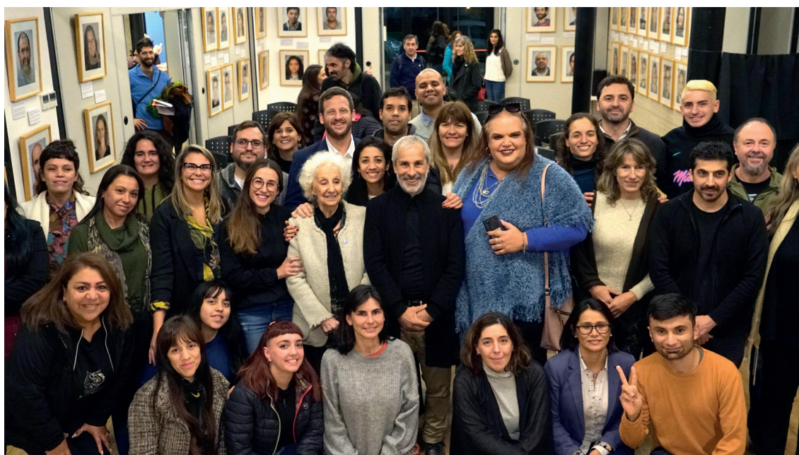
Figura 4. Presentación del proyecto Identidad en Redes en la ex Comisaría 5ta de La Plata.