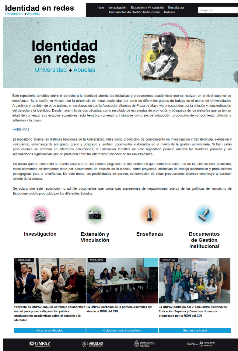
Figura 3. Diseño gráfico del repositorio y colecciones principales.