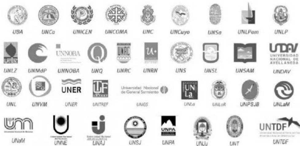
Figura 2. Salir del paper. La propuesta editorial nace en UNPAZ y propone expandirse al resto de las universidades.

Con origen en la Universidad Nacional de José C. Paz (UNPAZ), aspiramos a desarrollar un dispositivo comunicacional federal que articule y conecte a las universidades, que tienda puentes entre sus carreras, investigadores, docentes y estudiantes, que visibilice y dé volumen a nuestras ideas. Una herramienta abierta que cruza lenguajes académicos y mediáticos. El “paper” y el artículo, la investigación y la historia, la teoría y la experiencia como insumo de otro periodismo, como fuente de legitimidad inagotable. Un espacio colectivo que construye, que hace mientras dice desde su pluralidad de voces y realidades.