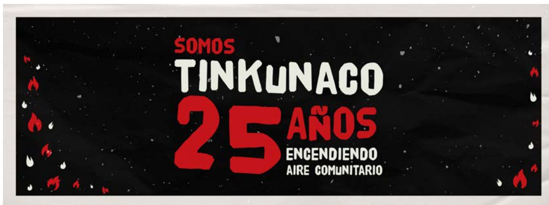
Desde 1998, FM Tinkunaco transmite en el Barrio San Atilio de José C. Paz.