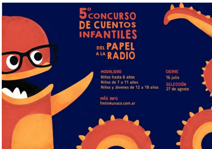
El concurso de cuentos que organiza FM Tinkunaco .