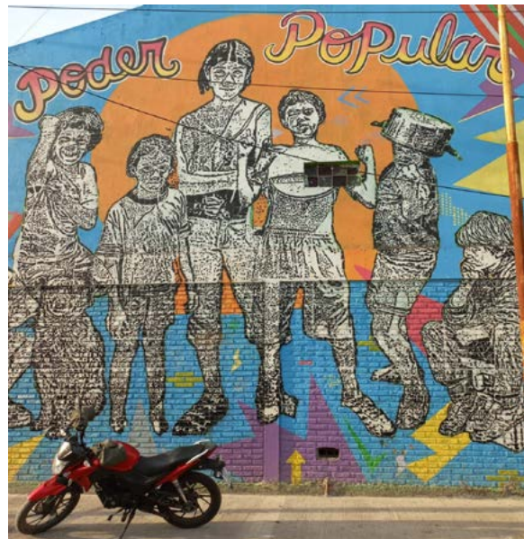
El mural en el frente del Centro Comunitario Belén, donde funciona FM Tinkunaco .