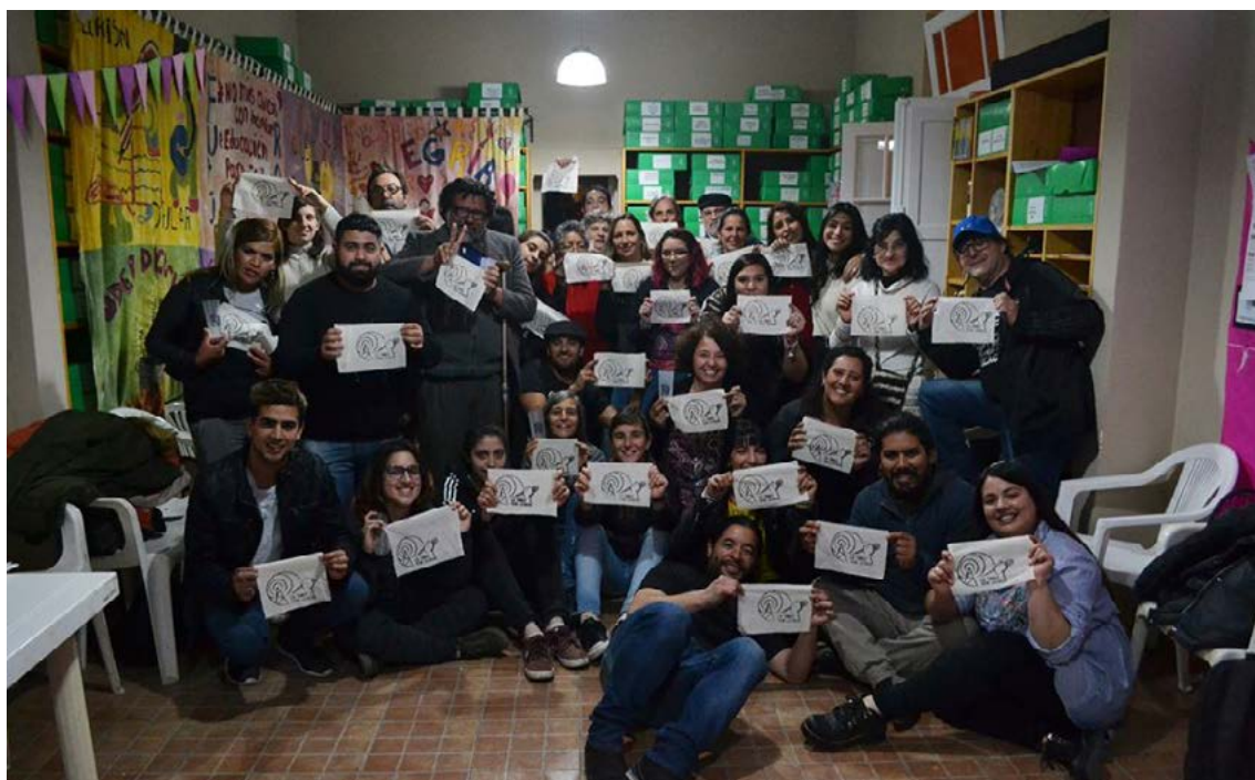
FM Tinkunaco celebra la obtención de su licencia. fmtinkunaco.com.ar

Las radios comunitarias con su energía conurbana que no se calla nada, que construye su propia agenda. Que no baila al compás de preconceptos ni de sometimientos rancios. Que danza a su propio ritmo, a su propio tiempo. Queda la certeza de que la libertad de expresión y el poder de las comunidades seguirán guiando el camino hacia un futuro más inclusivo y justo. Seguimos escuchando, seguimos hablando, seguimos construyendo juntos el compás de la democracia argentina, donde las radios comunitarias seguirán ATR.