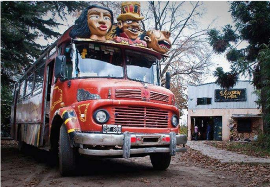
El carromato de El Culebrón Timbal , siempre rodando.