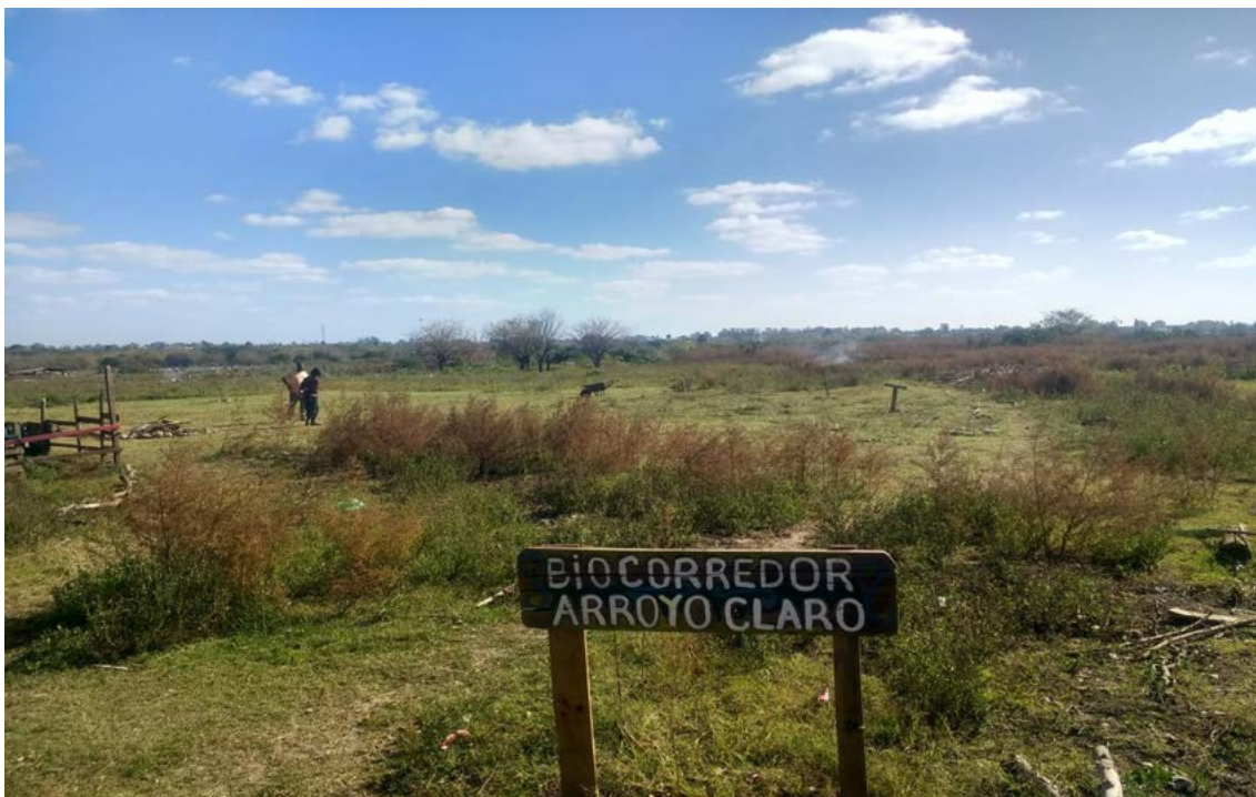
Arroyo Claro. Reserva Natural La Juanita.