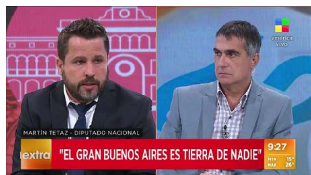
Tomado de América .

Las menciones de estos arrebatos hallados dan cuenta de una tierra que es de nadie porque “no hay policías”, porque “los delincuentes mandan”. O por los alucinados avatares consignados en cuentas de TikTok : desde un “Se colgó de una camioneta para que no se la robaran, golpeó contra un árbol y murió” hasta que la denominación “tierra de nadie”, se dice, “sería obvia”, pero que se robe en un caballo lo acerca al “lejano oeste”: ese significante cinematográfico de tiros, desolación y ley propia que puede parangonarse al televisivo “Conurbano profundo”.