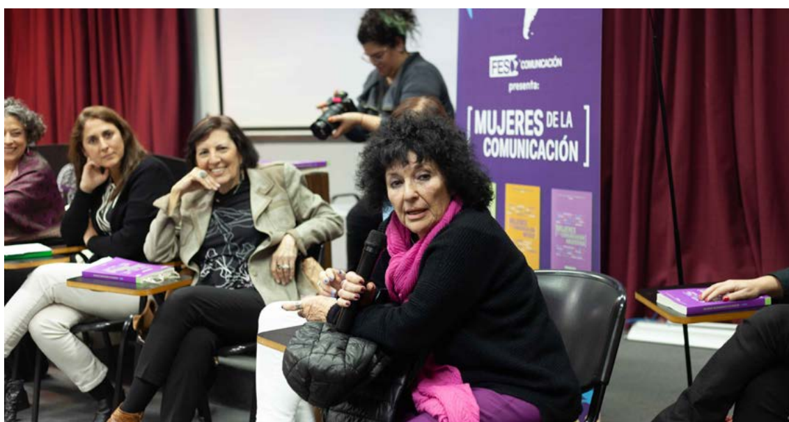
Presentación de Mujeres en la comunicación argentina en el marco del Congreso de ALAIC, el 29 de septiembre de 2022 en la Facultad de Ciencias Sociales de la UBA.